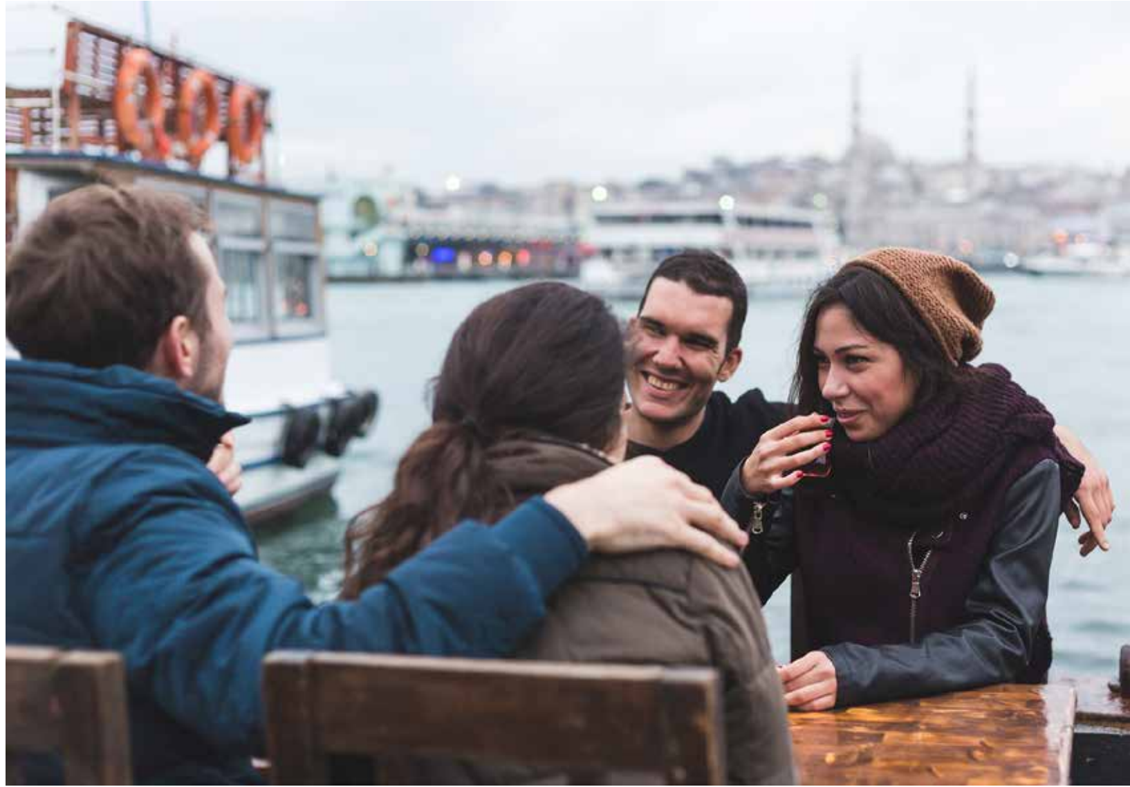
Turkin väestöstä noin kolmannes on alle 26-vuotiaita. Ikäluokan kriittisyys presidentti Erdoganin islamistista uskontopoliittikkaa kohtaan on voimakasta, ja monet ovat maallistuneita. Kuva Istanbulista.

Näiden kristittyjen joukossa on esimerkiksi tuhansittain naapurimaista tulleita pakolaisia, jotka ovat tulleet Turkissa uskoon ja kokoontuvat omissa yhteisöissään.