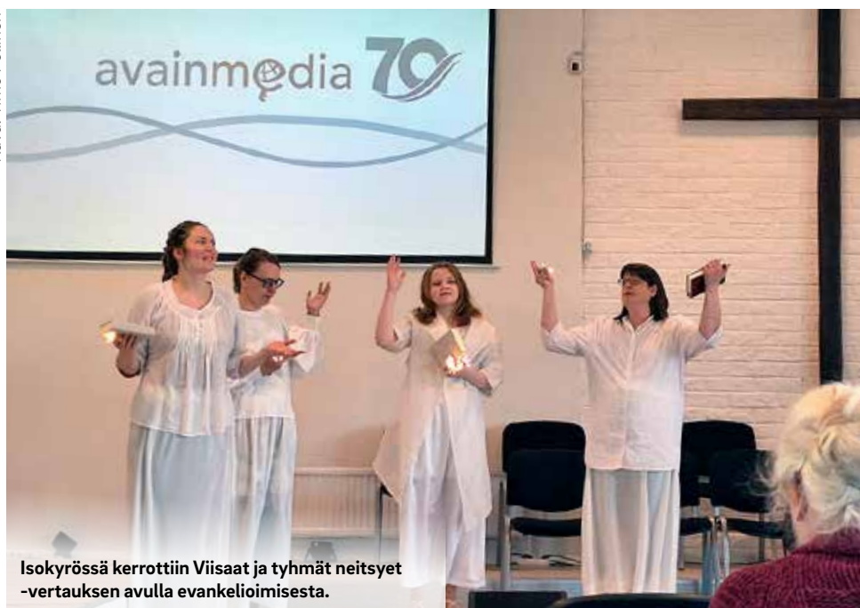
Isokyrössä kerrottiin Viisaat ja tyhät neitsyet -vertauksen avulla evankelioimisesta.