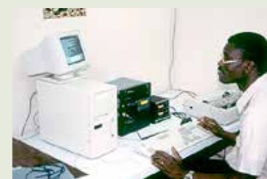
Sähköpostin lähettämistä radioaaltojen avulla 1997.

Aiemmin saattoi kestää kuusi viikkoa saada vastaus Pohjois-Amerikasta tai Euroopasta. Nyt lähetystyöntekijä saattoi saada vastauksen muutamassa minuutissa!