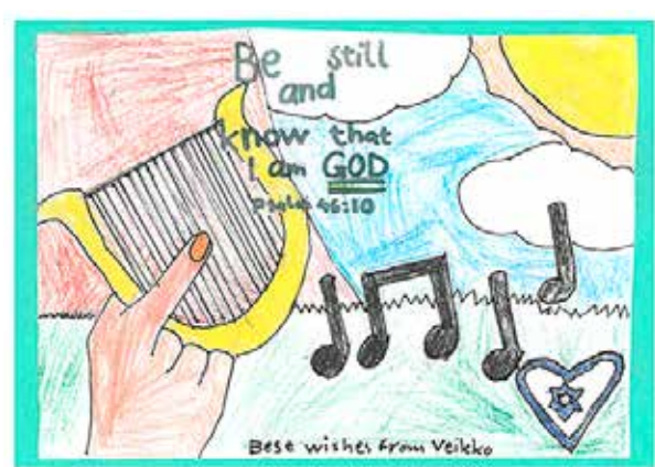
Keski-Uudenmaan kristillisen koulun oppilaiden tervehdykset. Moni liitti piirustukseensa englanninkielisen raamatunjakeen.