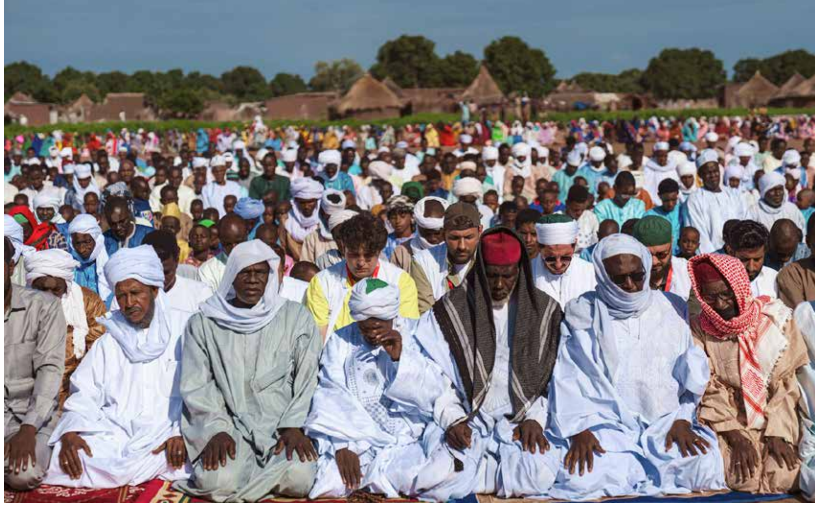
Muslimikulttuureissa islamista luopuminen nähdään koko yhteisön ja sen arvomaailman pettämisinä. Kuvassa afrikkalaisia muslimeja.